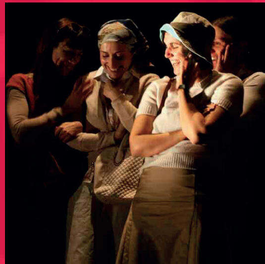
HIJAS DE LA MISERICORDIA