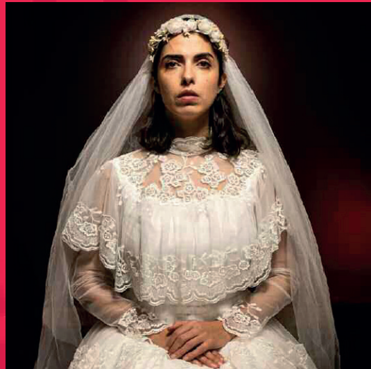
BODAS DE SANGRE