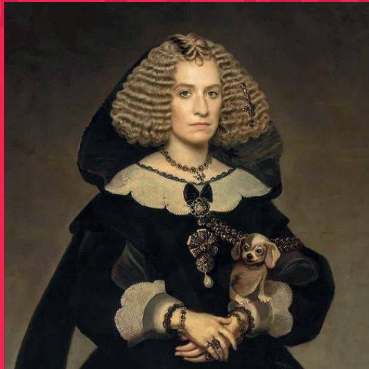
LA VENGADORA DE LAS MUJERES